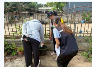
กิจกรรมสำรวจและทำลายแหล่งเพาะพันธุ์ลูกน้ำยุงลาย (Big Cleaning Day) ปี 2568