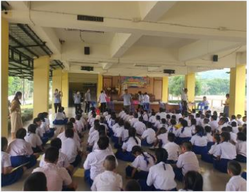
กิจกรรมพัฒนางานอนามัยโรงเรียนส่งเสริมสุขภาพ ปี 2568