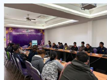
กิจกรรมประชุมภาคีเครือข่ายชุมชน โครงการ GREEN & CLEAN Hospital 2568 (กิจกรรมที่ 8) วันที่ 3 มกราคม 2568