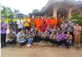
กิจกรรมออกเยี่ยมติดตามการบริหารจัดการวัดส่งเสริมสุขภาพ แผนการส่งเสริมและดูแลสุขภาพพระภิกษุสงฆ์ สามเณร อำเภอแม่แจ่ม จังหวัดเชียงใหม่ ประจำปีงบประมาณ 2568