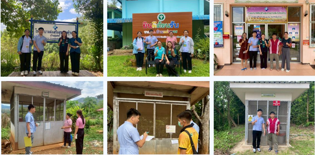
กิจกรรมออกนิเทศติดตามการบริหารจัดการมูลฝอยติดเชื้อในสถานบริการสาธารณสุขอำเภอแม่แจ่ม แผนพัฒนางานอนามัยสิ่งแวดล้อมและอาชีวอนามัย ประจำปีงบประมาณ 2568

ชื่อโรงพยาบาลเทพรัตนเวชชานุกูล เฉลิมพระเกียรติ ๖๐ พรรษา จังหวัดเชียงใหม่